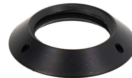
Écrou de sécurité Référence de commande: 53211