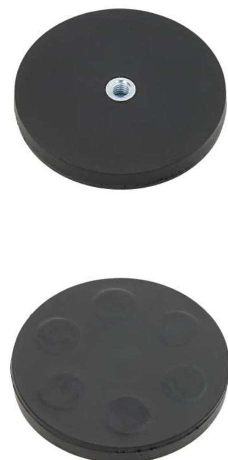
Support de montage magnétique (comprend le support de montage 53317) Référence de commande: 53330