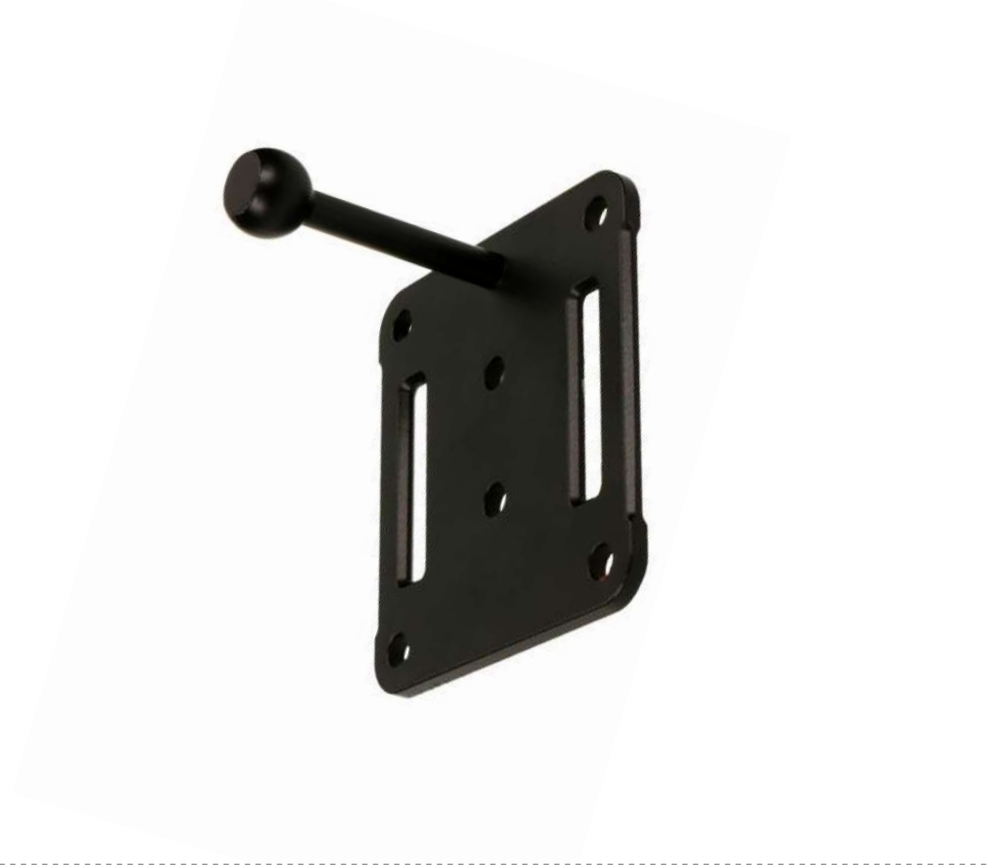
Équerre de montage Référence de commande: 53317