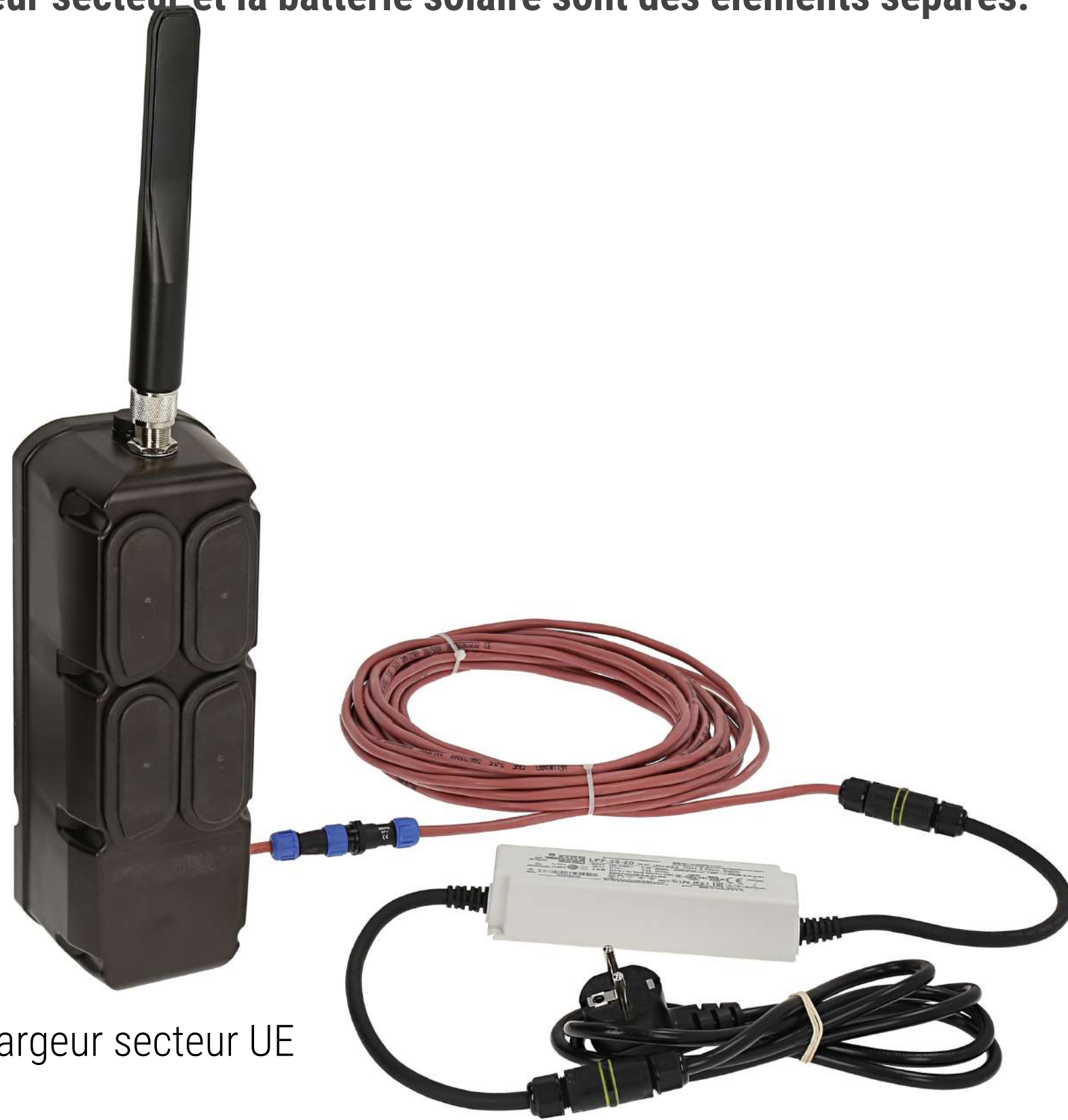
Le chargeur secteur UE

NB! Le chargeur secteur et la batterie solaire sont des éléments séparés.