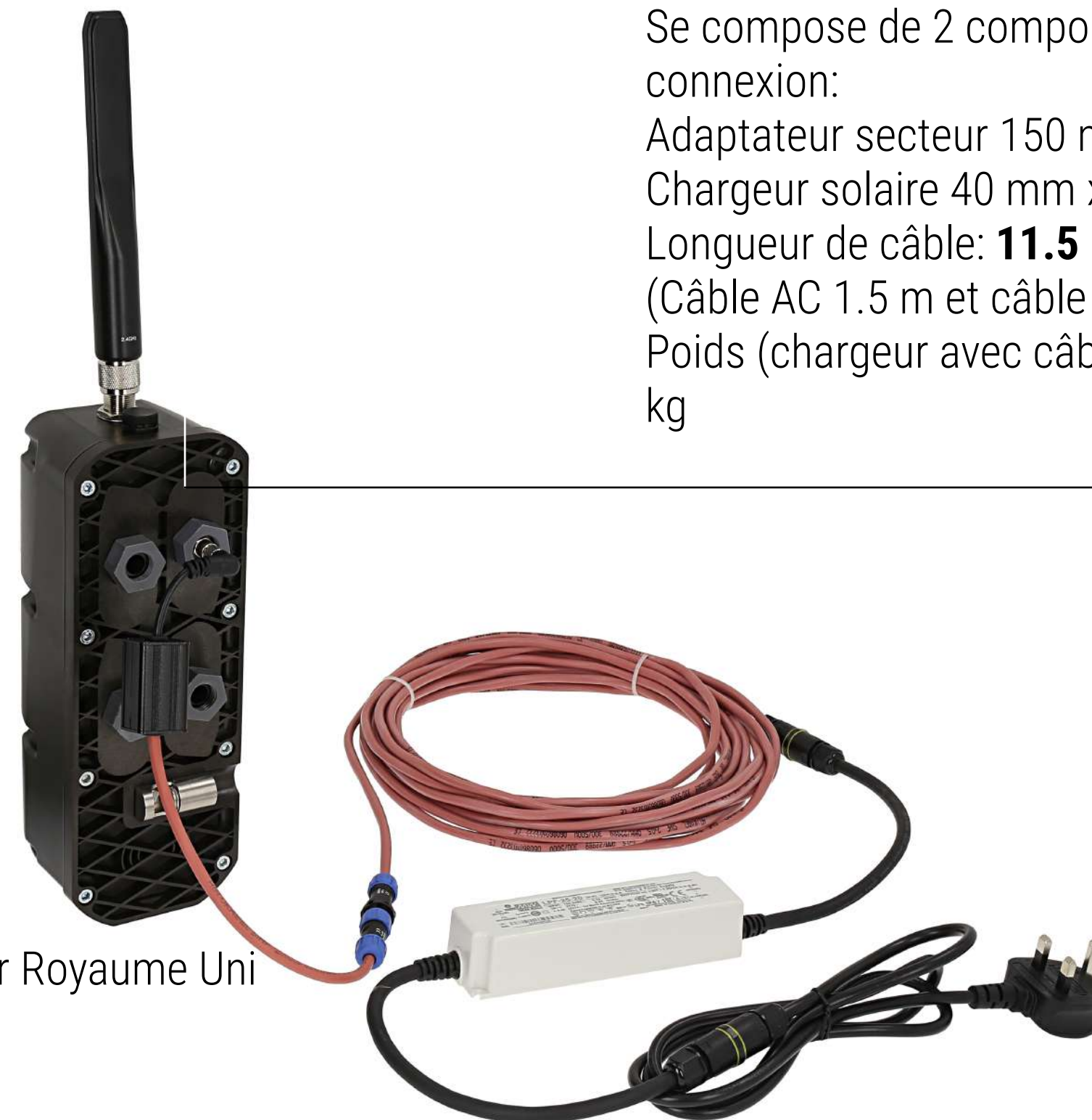
Le chargeur secteur Royaume Uni

Dimensions: Se compose de 2 composants et de câbles de connexion: Adaptateur secteur 150 mm x 40 mm x 35 mm Chargeur solaire 40 mm x 25 mm x 25 mm Longueur de câble: 11.5 m (Câble AC 1.5 m et câble DC 10 m) Poids (chargeur avec câblage sans batterie): 1.2 kg