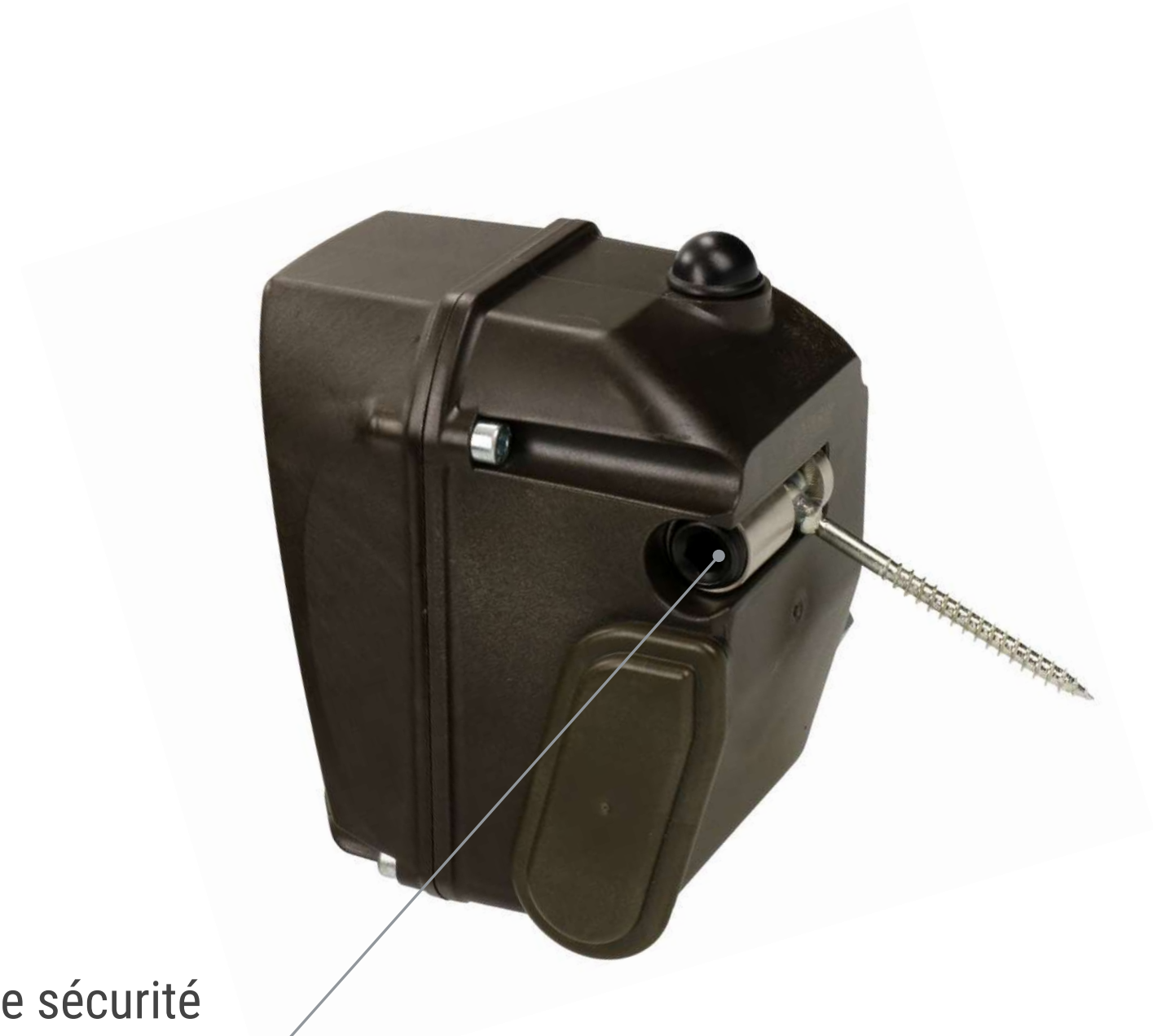
Boulon hexagonal de sécurité Référence de commande: 53324